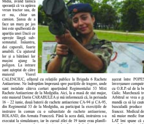
asizat intru POPESCU (din mijloc) și asigurați "FALCONUL". Care sosește la ora stabilită și își începe evoluția deasupra poligonului. Dar, purce unul la aceeași valoare ca a MIG-ului nostru.

Este adăscută că ziua de final a sărit de dimineață promițătoare. Fier de deasupra poligonului fiind ideal pentru lansare. Militarii francezi deshid focal. Cer spirin părții române în vederea executării în comun. Acesta urmat a fi făcut pe o bombă luminoasă. Poligonarii din drumul la mârșă. Francezii la racheta. Mai bine nu