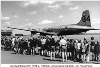
Planul Marshall nu face decât să contribuie la furașă definităv între „cele două blocuri”

La prama întâlnire dintre cei „trei mari”, F.D. Roosevelt, I.V. Stalin și W. Churchill, la sfârșitul lui noiembrie 1943, s-au purtat convorbiri mai mult informative în legătură cu ordinea de după război. S-a conștinat în decurs de „Design” a lui Roosevelt; lui Stalin i se asigură venirea asupra graniței de vest a U.R.S.S. din 1941 (reînchiragarea Poloniei de