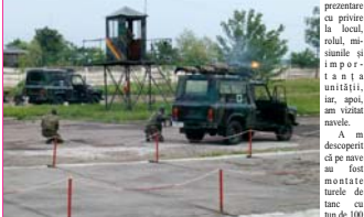
În cadrul temei "Terorismul - fenomen politico-militar internațional de actualitate" ne-

mm, mitraliere de 14,5, lansatoare de proiectile reactive, dar m-a impresionat cel mai mult felul